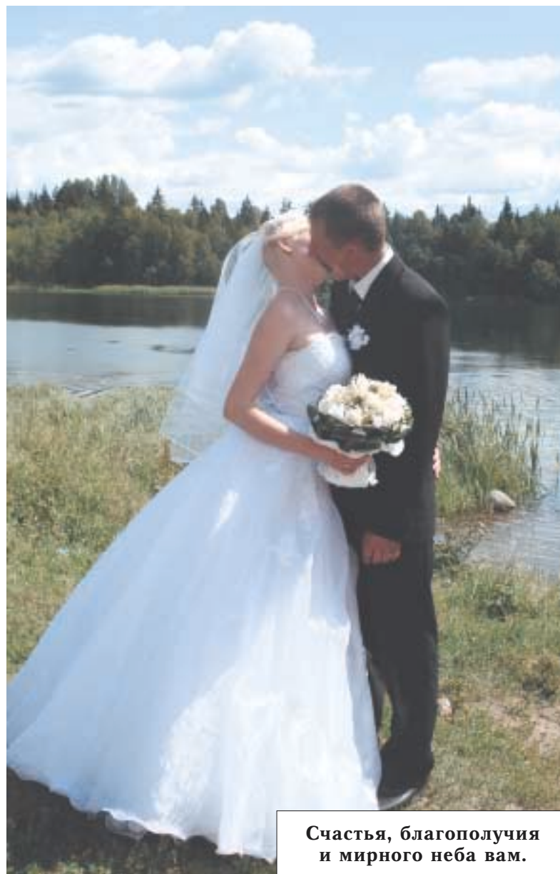
Счастья, благополучия и мирного неба вам.