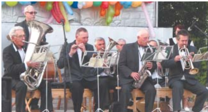
Духовой оркестр из Луги порадовал собравшихся живой музыкой.

2 августа на центральной площади поселка прошел праздник «Скоро осень, за окнами август!...». Концертная программа состояла из 3-х частей. Открыли ее гости из г. Луги — духовой оркестр. Далее эстафету подхватили самодеятельные артисты из Острова, ну а после празднование продолжилось зажигательной дискотеккой.