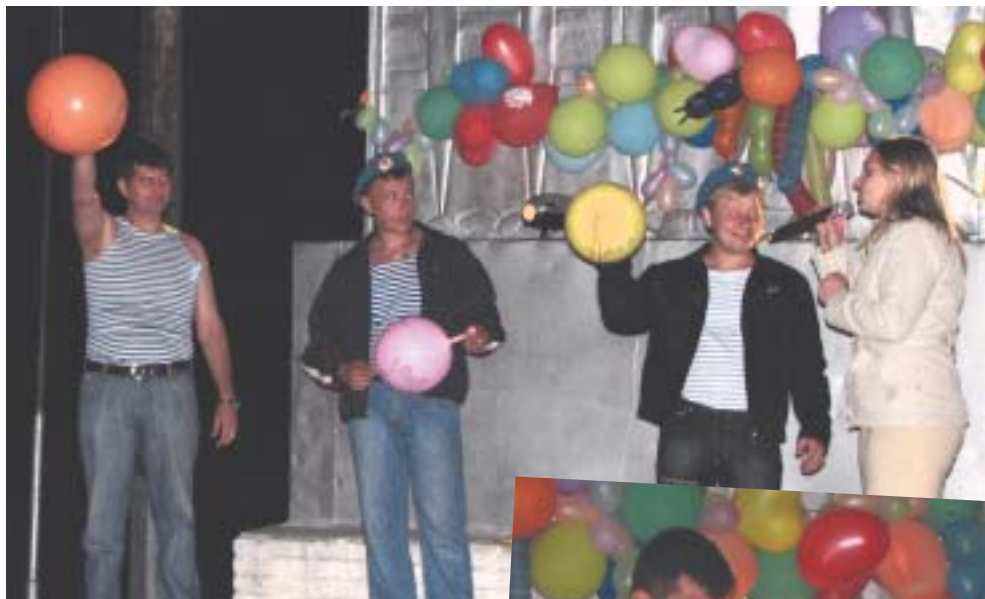
Для настоящего десантника — главное не размер, а дальность полета!