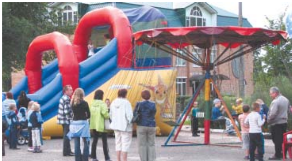
Для юных жителей и гостей поселка развлечения на любой вкус.