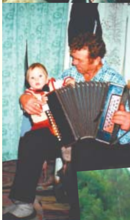
«Научу-ка я внука играть на гармошке».