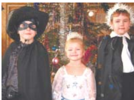
Юные сказочные герои на Новогодней елке в РДК.

Всех, кто пришел в библиотеку 4 и 5 января, ожидала праздничная новогодняя программа. Загадки, веселые конкурсы, забавные состязания, «салат» из сказок и мн. др.