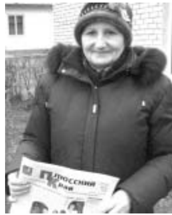
Спрашивала Л. Панова.