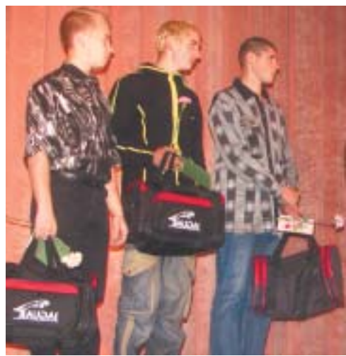
«Вы служите, а мы подождем».

Глава райадминистрации тепло поздравил их с этим событием.