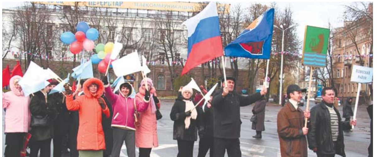
Делегация Плюского района.

4 ноября 1612 г. народное ополчение под предводительством Кузьмы Минина и Дмитрия Пожарского освободило Москву от интервентов. В 2005 г. по указу Президента РФ В. Путина этот день стал государственным праздником — Днем народного единства.