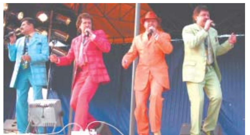
В подарок — концерт группы «Доктор Ватсон».