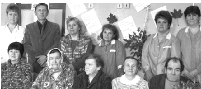
В Доме-интернате.

Наша работа требует не только медицинского образования и специальных