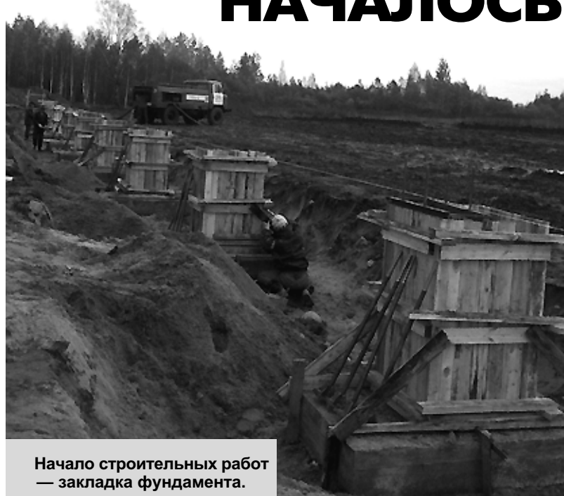
Начало строительных работ — закладка фундамента.

— Ведь наша область очень богата торфом, который исполь-