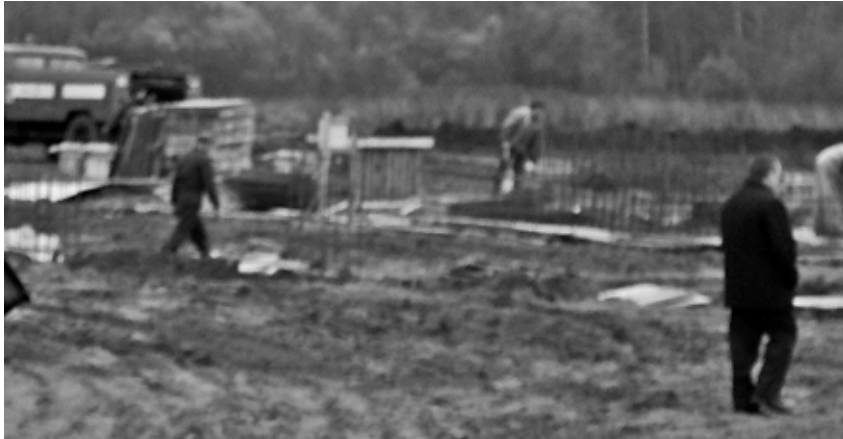
На строительной площадке работы ведут специалисты ООО «УИМП».