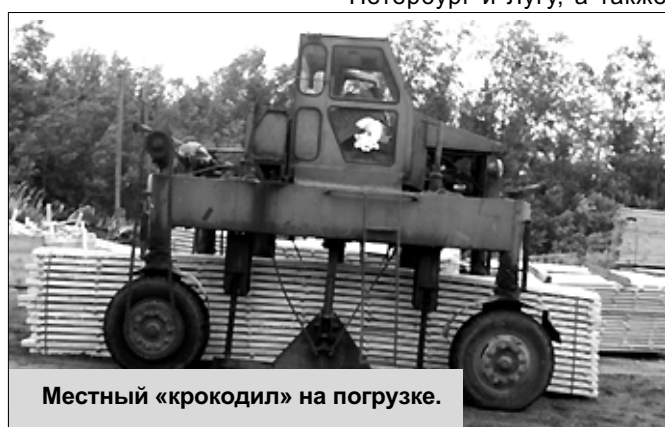
Местный «крокодил» на погрузке.

Сразу же приступили к строительству сушилок: готовая продукция, на которую в принципе ориентировано производство, должно отвечать высоким требованиям качества, чтобы иметь спрос на рынке. Ведь только тогда можно рассчитывать на получение прибыли.