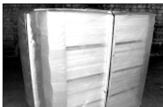
Упакованные комплекты садовой мебели.

— на экспорт. Своей очереди к отправке дожидаются готовые, упакованные комплекты садовой мебели — на фирму «Икеа». С нею партнерские отношения только налаживаются, но уровень требований к качеству, экологических данных на Плюсском ДОКе уже успели оценить: они высоки. Конечная цель, которую