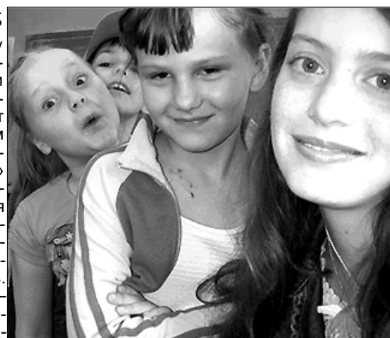
Полосу для печати подготовила С. Рыбалко.

Тех, кому сегодня 13-14 лет и все это интересно, ждут в клубе 28 июля в 15 часов в библиотеке.