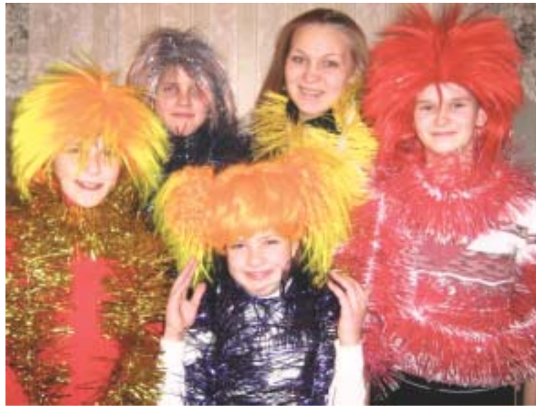
Театральная студия «Золотая маска».

Своими знаниями и умениями она охотно делится с окружающими — ведет занятия со школьниками в театральной студии «Золотая маска». Вместе они участвовали в осенней ярмарке, концерте, посвященном Дню народного единства, районном соревновании «Мама, папа, я — спортивная семья». Сейчас полным ходом идет подготовка к Новому году.