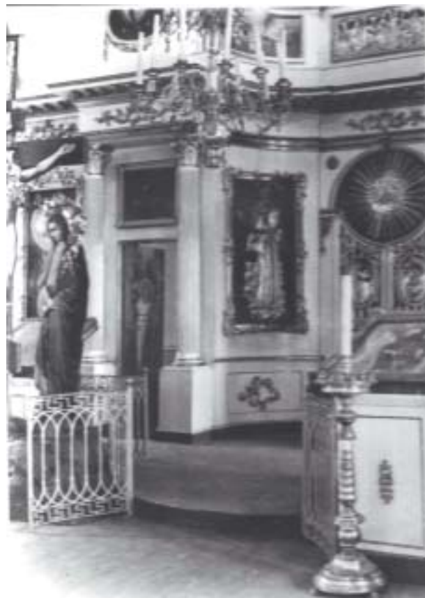
Алтарь, находившийся в церкви Николая Чудотворца.