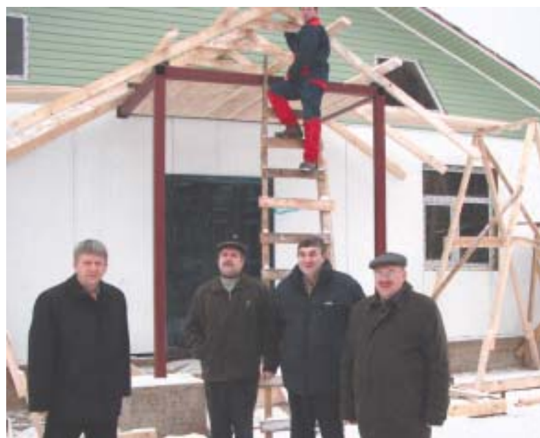
Оставшийся комплекс работ планируется завершить до 20 декабря.