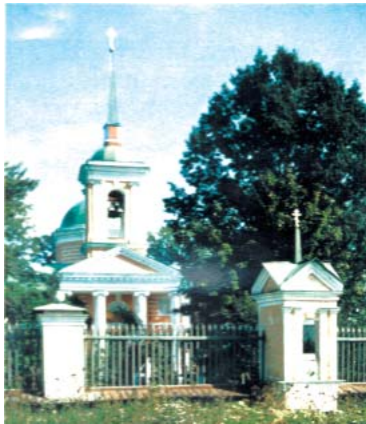
Церковь в Крицах. 4 км от Любенска. 1913 г.