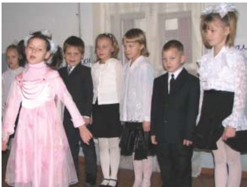
Концертный номер в подарок от подрастающего поколения.