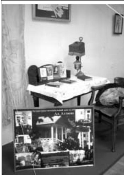
27 октября в Литературно-мемориальном музее Ал. Алтаева в д. Лог состоится научная конференция «Столица и усадьбы», по-