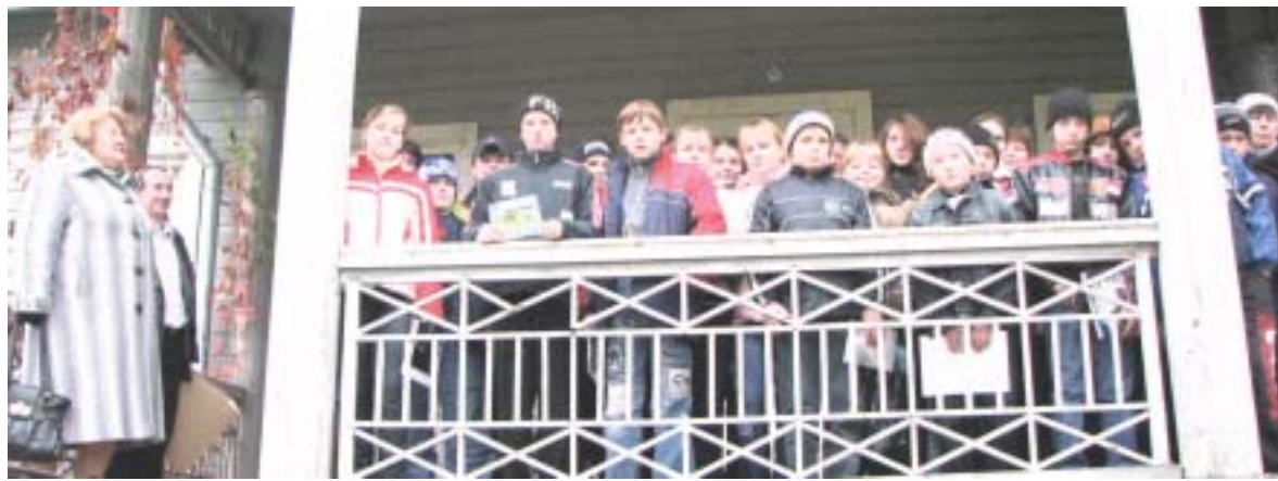
Участники конкурса в Вечаше.

День, 23 октября, выдался хоть и не дождливым, но хмурым, даже оставшиеся еще кое-где на деревьях золотистые листья не сделали его более приветливым.