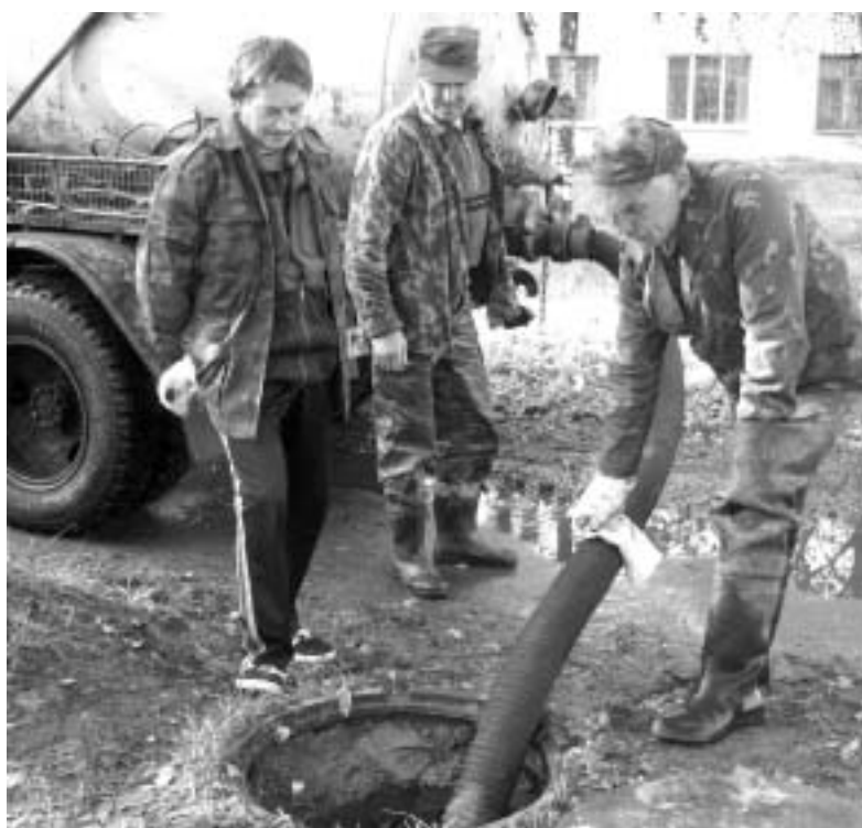
У работников МП «Жилкоммунсервис» работы много.