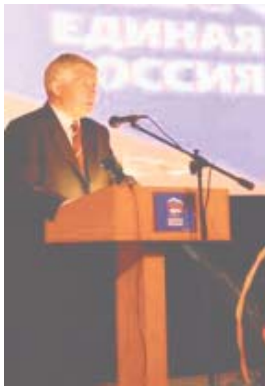
18 сентября в Пскове состоялся второй этап XI отчетно-выборной конференции Псковского регионального отделения партии «Единая Россия».