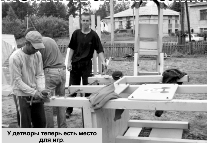
У детворы теперь есть место для игр.